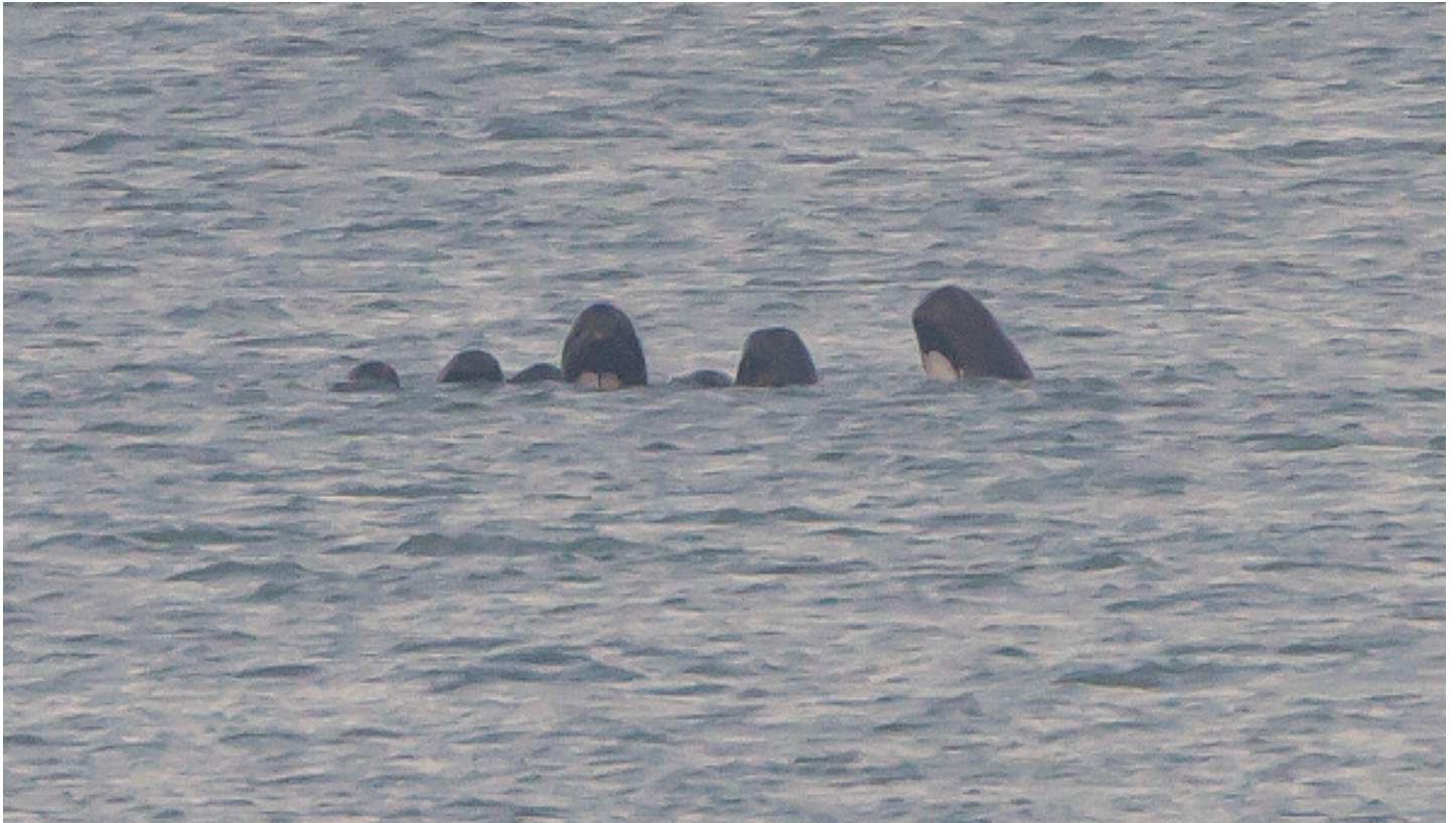
Zeven grienden (en een kring in het water van de achtste) op 28 oktober bij Scheveningen. De witte keel en bolle kop zijn duidelijk zichtbaar.