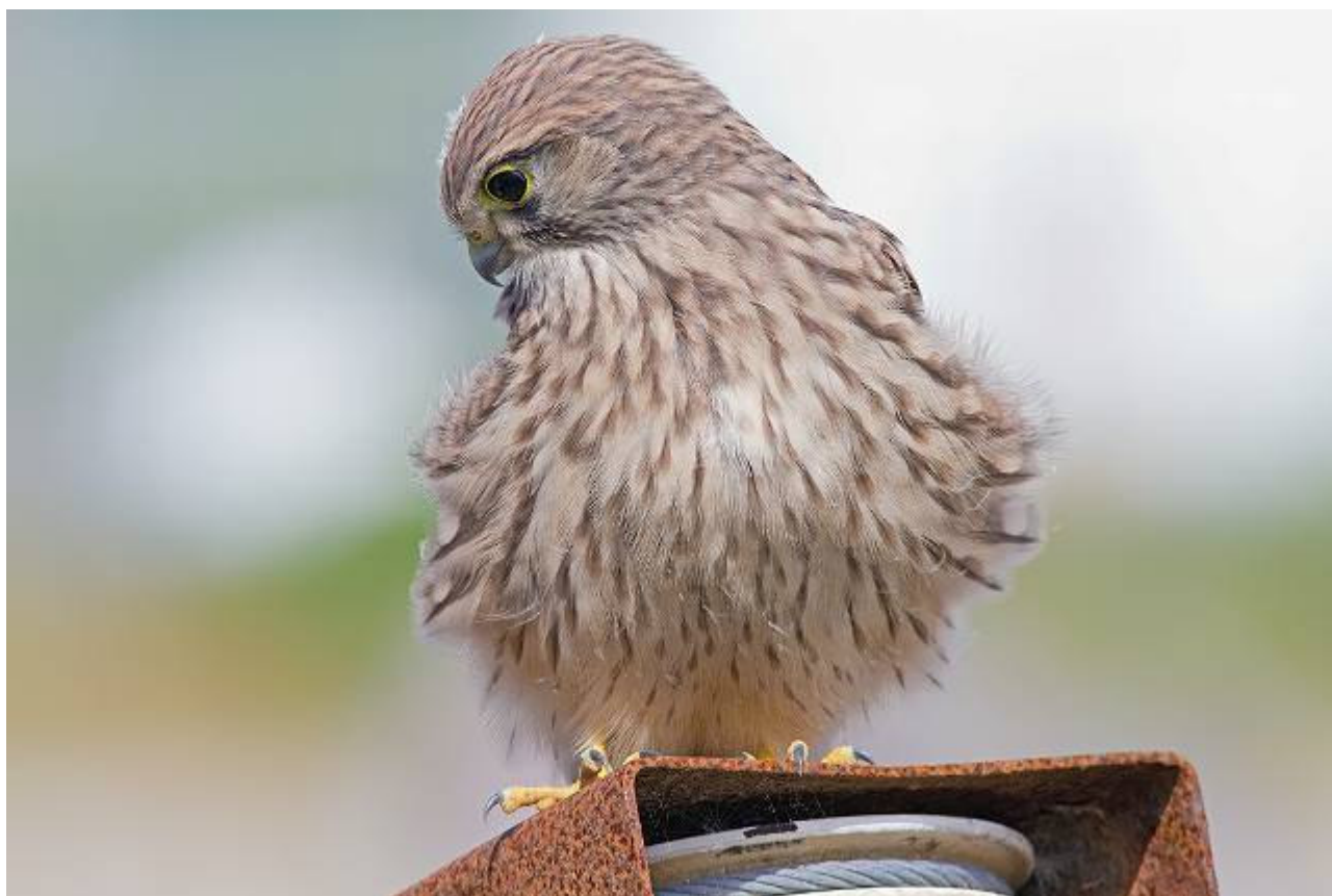
Het eerst uitgevlogen Houtrustweg-jong van 2012.