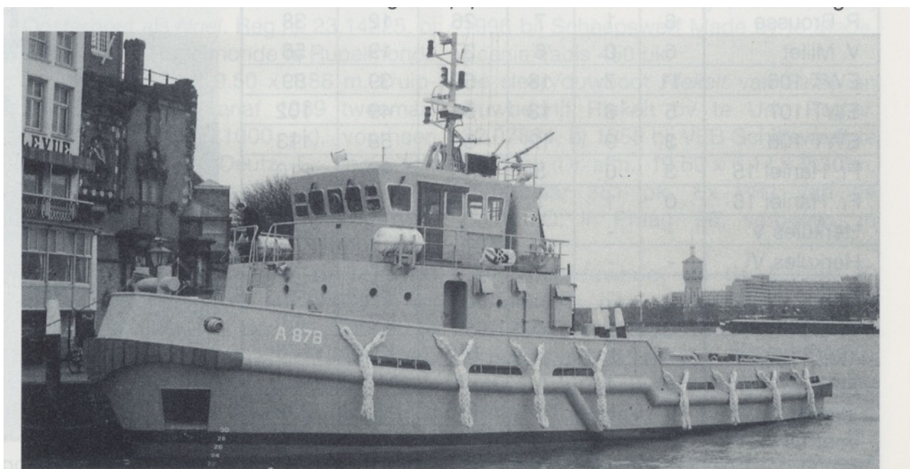
Vlootuitbreiding bij de Koninklijke Marine met de GOUWE