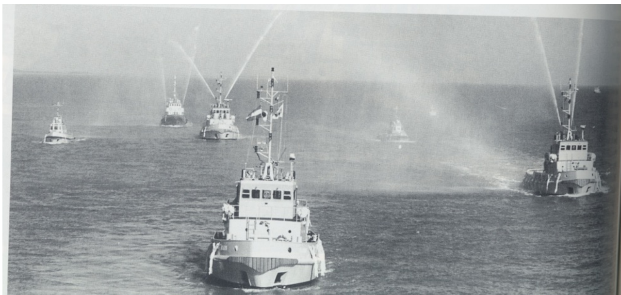
De aankomst van de nieuwe, door Damen gebouwde marine-sleepboot GOUWE in haar thuisbasis Den Helder op 6 maart 1997 was een heel spektakel. Voorafgegaan door de WESTGAT en de WAKER (van de Kustwacht) voer de GOUWE naar binnen, gevolgd door de zusterschepen BALGZAND en BREEZAND, verschillende kleine marine-sleepboten en ten slotte de LIES en PIETER van de Rederij Waterweg, met spuitende bransblusmonitoren